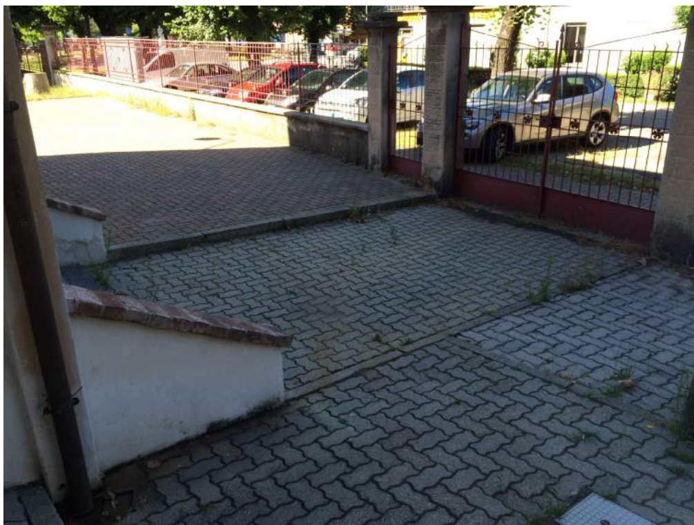
Foto 10 – Ingresso carraio e pedonale secondario da Via IV Novembre