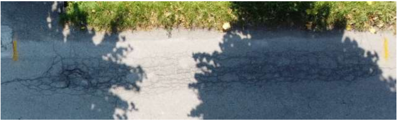
8) Via Cristoforo Colombo con ingresso da Via XXV Luglio.